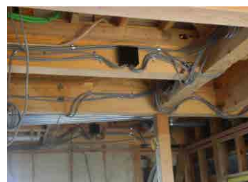
張り巡らされた配線 総延長は1棟あたり約950m